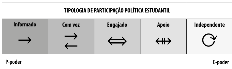
Figura 2. Tipologia de participação política estudantil

comunicação entre professores e estudantes (representada por setas e círculos). A tipologia foi elaborada fazendo-se distinção entre 'informar' e 'comunicar'. Nas palavras de Erik Andersson (2018, p. 153), "por informar compreende-se uma instrução unidirecional ou transmissão de "fatos" e informações, enquanto a comunicação é definida como o processo através do qual os indivíduos agem de forma conjunta para alcançar um objetivo comum" ( tradução nossa ).