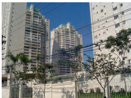
Foto 5 – Condomínio residencial na Mooca, implantado em antiga área industrial