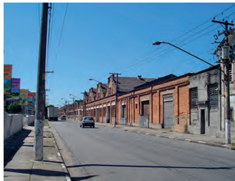
Foto 2 - Galpões industriais na Mooca, muitos deles desativados