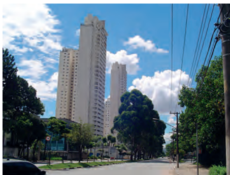
Foto 4 – Condomínio residencial na região de Jurubatuba, Santo Amaro, implantado em antiga área industrial