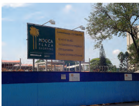
Foto 6 – Shopping Center em construção na Mooca, sobre terreno anteriormente ocupado pela Ford

Além dos antigos terrenos industriais, postos de abastecimento de combustíveis e depósitos irregulares de resíduos, bastante frequentes na periferia da cidade, também apresentam potencial de contaminação do solo por processos químicos. Dentre as áreas com possíveis problemas de contaminação encontram-se ainda as chamadas “áreas órfãs”, que são terrenos abandonados cujos proprietários são desconhecidos, ou que pertencem a massas falidas, o que dificulta bastante a adoção de medidas de recuperação, que só se viabilizariam através de programas com a utilização de recursos públicos, como acontece em outros países.