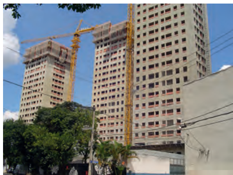
Foto 3 – Condomínio residencial em construção na Vila Leopoldina, implantado em antiga área industrial