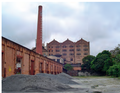
Foto 1 - Antiga indústria metalúrgica ocupada por sem-tetos na Mooca

Essa dinâmica, aliada às formas de apropriação do espaço, produziu um território fragmentado com grandes áreas desarticuladas na cidade, muitas delas resultantes do esvaziamento de antigas zonas industriais que se implantaram ao longo dos eixos ferroviários, elementos determinantes na estruturação da metrópole, gerando uma paisagem na qual se destacam terrenos baldios, galpões e armazéns desocupados, além de inúmeras outras edificações em estado de contínua deterioração (Fotos 1 e 2).